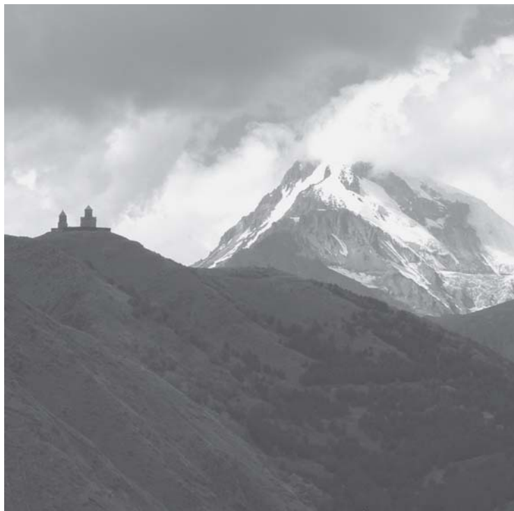
გერგეთი, წმიდა სამების მონასტერი